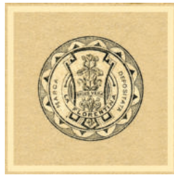
1894 marca depositata