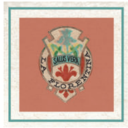
1911 sapone millefiori di Firenze