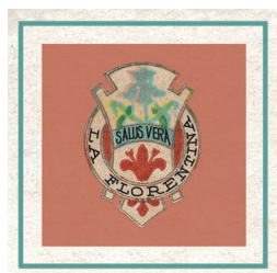
1911 sapone millefiori di Firenze