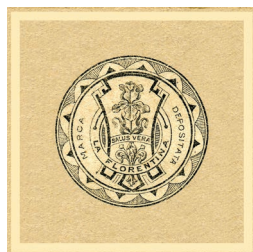
1894 marca depositata